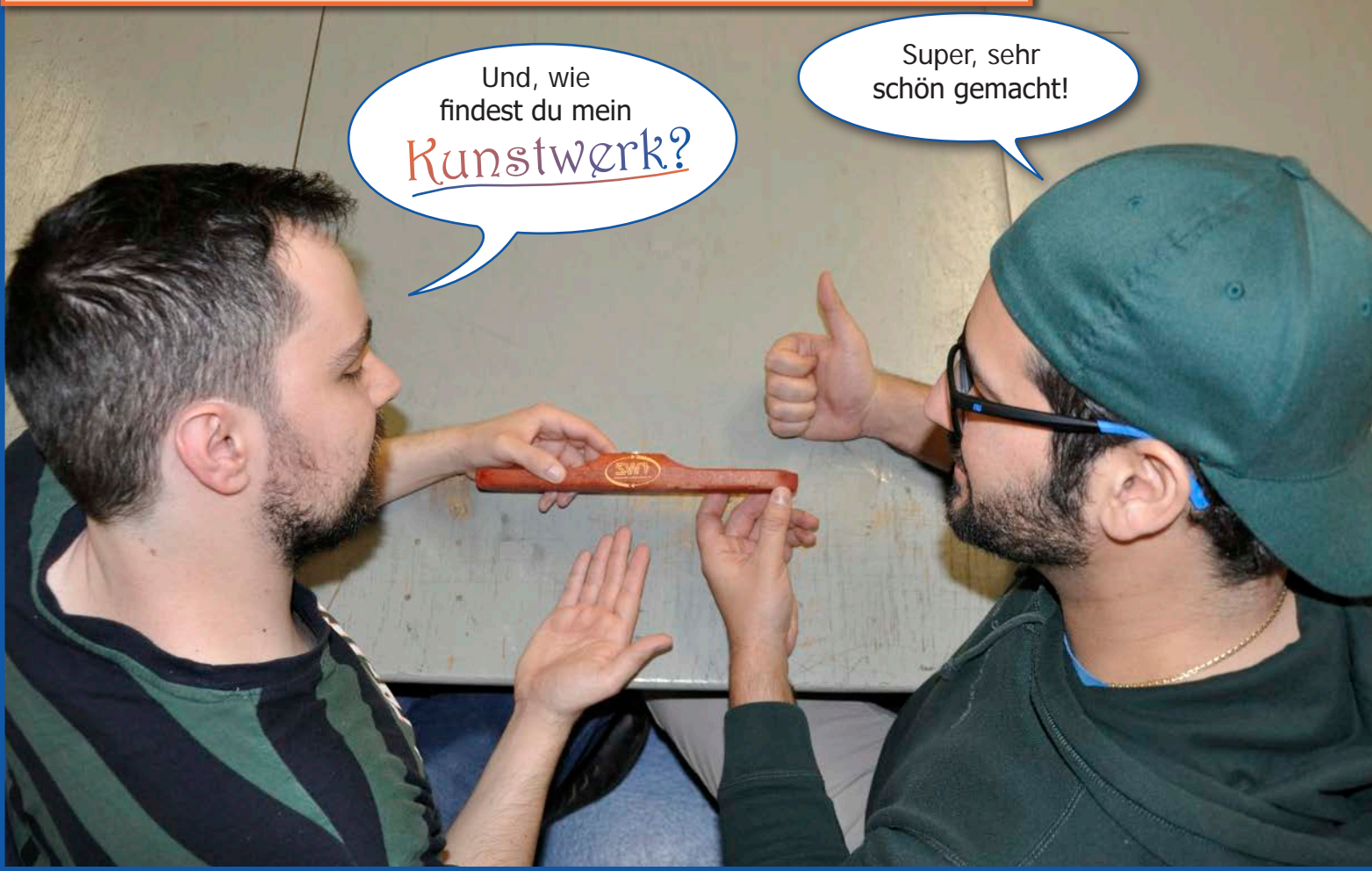
Teamwork: Begutachtung des hochwertigen - aber noch haarlosen - Wischers

Jaja, langsam pressierä! Die Tampondruckfarbe ist schon angemischt.